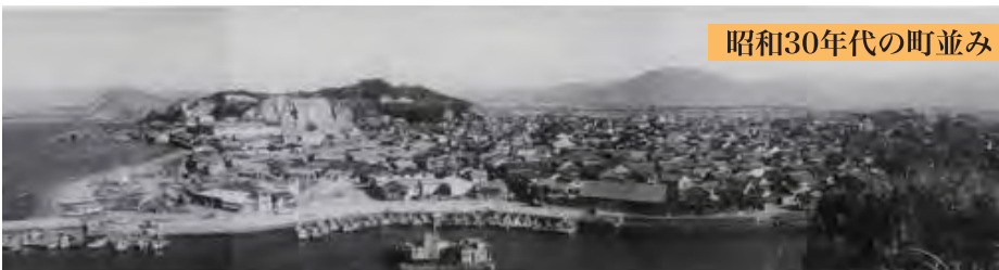
昭和30年代の町並み

今回は旧能古渡船場(現在の姪浜魚市場付近)周辺の町並みの変遷です。上の写真は昭和30年代のもので、昔の渡船場は今よりかなり南側にありました。それだけ海岸の埋め立てが進み、それに合わせて渡船場も北側に移ったということ。この付近は今でも魚市場や旧料亭の建物が残っており、港町の名残を感じさせてくれます。ちなみに福岡市内に魚市場があるのは、長浜と姪浜だけです。