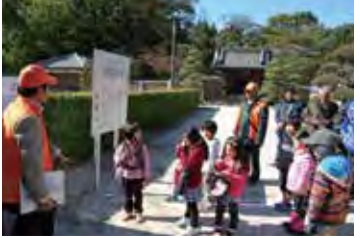
子どもまちなみ探検隊

この他にも、恒例となつた「歴史散策と桜の名所巡り」「子どもまちなみ探検隊」等を実施しました。