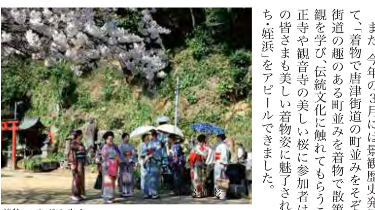
着物でそぞろ歩き

その代表的なものが、昨年9月に実施した「遊覧船で巡る福岡の歴史とまちなみ」です。これはまち歩きとマリノア遊覧船「ゆーみんトマト」による博多湾回遊を組み合わせたガイドツアーで、従来のまち歩きに加え、博多湾から姪浜周辺を眺め、歴史解説を行うことで、海との関わりの深い姪浜の歴史をより知っていただくことができました。