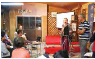
ヤップ夫妻のトークショー