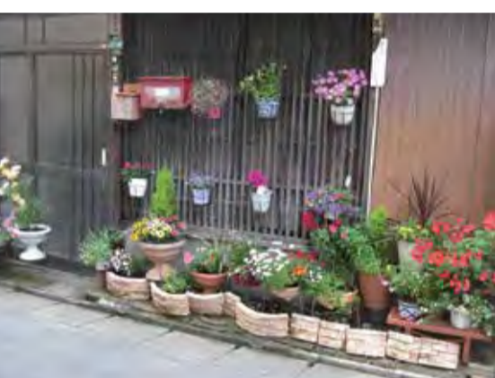
花を飾った古民家

もう一つは、古い民家の外壁に花を飾り、道行く人に潤いと季節感を演出している例です。いつ見てもきれいな花が咲いており、ほつとする気持ちになります。こうした町並み形成への一人ひとりの参加の積み重ねにより、姪浜の町並みもさらによくなっていくと思います。