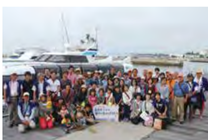
遊覧船ツアーを終えて

平成19年度から実施している各種イベントも年々充実しています。その根底にあるのは「姪浜らしさ」へのこだわりです。