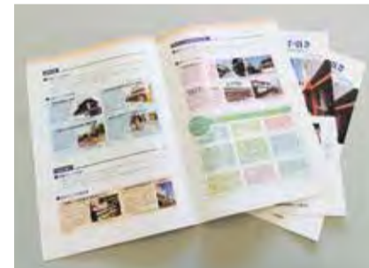
景観づくりの手引き

平成26年3月に策定した「姪浜景観づくり計画」の内容を地域の方々に広く知っていただき、活用していただきたいと考え、それをわかりやすく示した「姪浜景観づくりの手引き」を同年10月に発行しました。まちづくり協議会と景観づくり委員会では、地域の集まりでの出前講座やみそ蔵でのパネル展等を開催し、この手引きを活用して地域の方々とともに姪浜ならではの地域特性を活かした景観づくりに取り組んでいきたいと考えていますので、皆さま方の積極的な参加をお願い申し上げます。